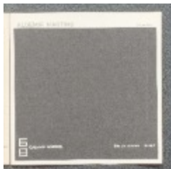
Aldemir Martins : desenhos (000580.64)