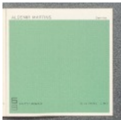
Aldemir Martins : desenhos (000580.47)