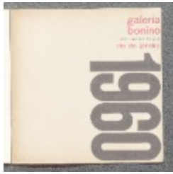
Exposição inaugural (000580.1)